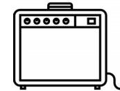
Roger Harp Amp xlr out